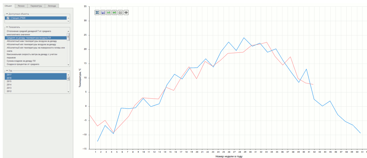
Рис. 2. Анализ временных рядов агрометеорологических данных

Непосредственно в системе возможно проведение контролируемой или неконтролируемой классификации данных. Это позволяет в автоматическом режиме распознавать различные типы растительности и строить карты.